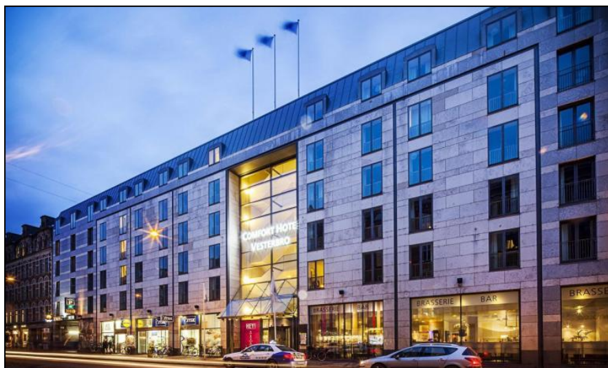
L'hôtel Comfort Hotel Vesterbro Vesterbrogade 23/29, Copenhague 1620, Danemark

Les chambres du Comfort Hotel Vesterbro sont dotées de la climatisation, d'une télévision par câble et de parquet. Leur salle de bains est pourvue d'un sèche-cheveux et d'articles de toilette. Il propose une connexion Wi-Fi gratuite et un petit-déjeuner buffet varié.